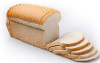
wit brood het witte brood