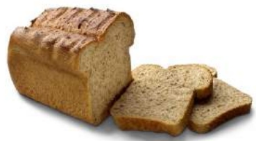
bruin brood het bruine brood