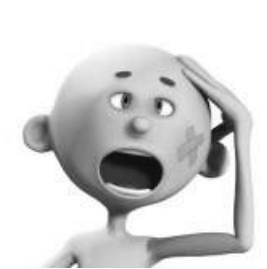
ik ben kaal